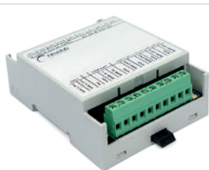
DALI-4CV (L406MA0GT4A03) DALI-4CC (L405MA0GC4A03)